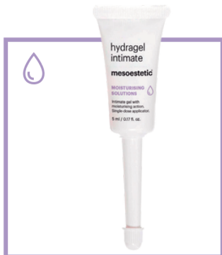
12 доз x 5 мл

Наповнює та відновлює об'єм тканин великих статевих губ задля збереження їхньої захисної функції та покращення їхнього вигляду.