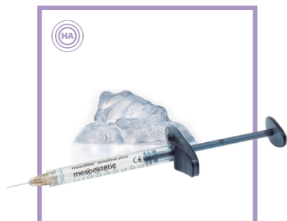
2 шприци X 1 мл